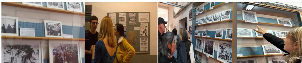
Exposición de fotos sobre las Ligas Agrarias y el MRC realizada en el marco de la EXPO IIGG, el 3 de octubre de 2024.