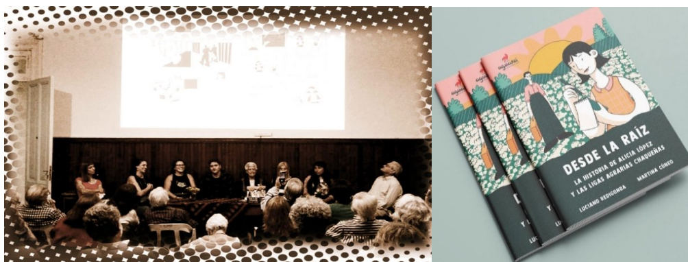
Presentación de la historieta Desde la Raíz , 8 de abril de 2022. Iglesia Santa Cruz, Buenos Aires.