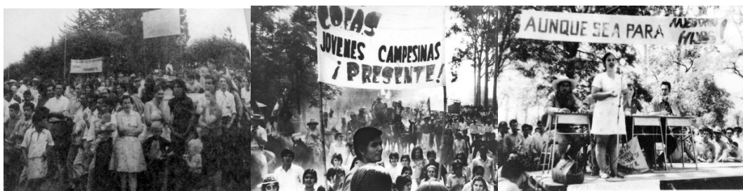
Acciones colectivas con participación de las mujeres liguistas. Misiones y Formosa. 12

progresivamente a discusiones generales. En 1973 las mujeres realizaron en Corrientes el primer encuentro de campesinas de las Ligas de toda la región, que visibilizó sus necesidades y motivó un segundo curso en Reconquista, en 1974, donde se discutió el lugar de las mujeres en la historia. Muchas recuerdan que dentro de la organización algunos hombres consideraban estas cuestiones “secundarias” y había que convencer a las familias para que las mujeres pudieran asistir a los encuentros.