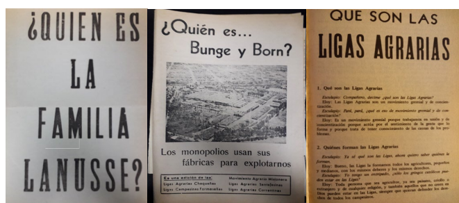
Cartillas de formación. 13