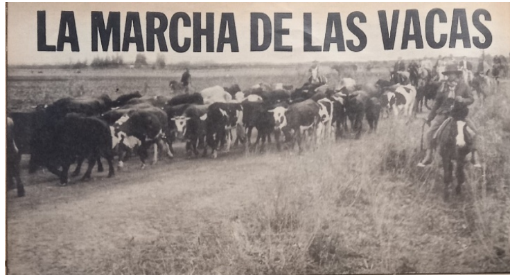
Revista Así , septiembre de 1972. 14