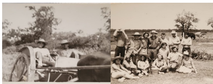
Primeros viajes de campo al norte chaqueño, 1970.

integrando su comisión central, hasta que ambos fueron detenidos-desaparecidos en abril de 1975 y puestos en libertad en agosto del mismo año. Ese mismo día Quique decidió clandestinizarse en el monte para resguardarse de la represión, donde permaneció hasta mediados de 1978 cuando logró exiliarse. Adelina regresó a Buenos Aires donde volvió a ser secuestrada en 1976 permaneciendo desaparecida durante 4 meses. Tras su liberación en diciembre, continuó la persecución y fue cesanteada de la escuela donde trabajaba. Aparece en los listados sobre personas desaparecidas de la APDH como Adelina de León Lovey. Hasta nuestros primeros contactos en 2018 nunca había testimoniado por la represión en el campo de Chaco ni por su cautiverio en la Ex Brigada de Investigaciones de Resistencia.