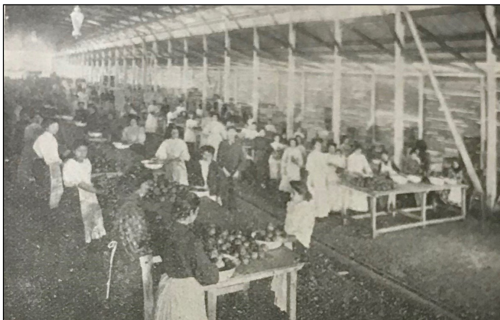
Figura 1. Sección de peladura de frutas y legumbres.