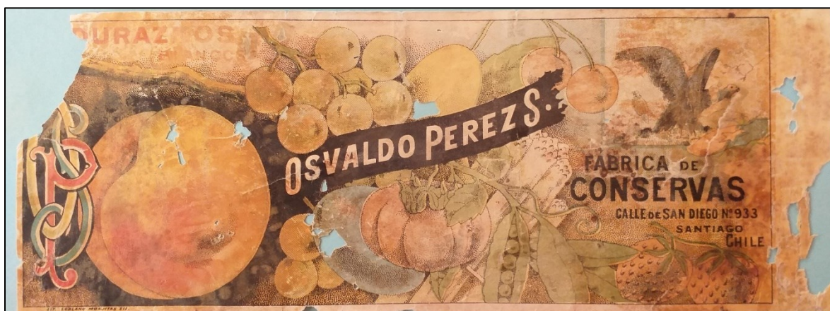
Figura 2. Etiqueta Fábrica de Conservas de Santiago