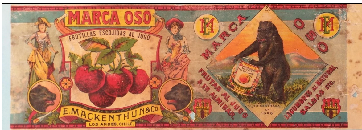
Figura 2. Etiqueta Marca Oso.